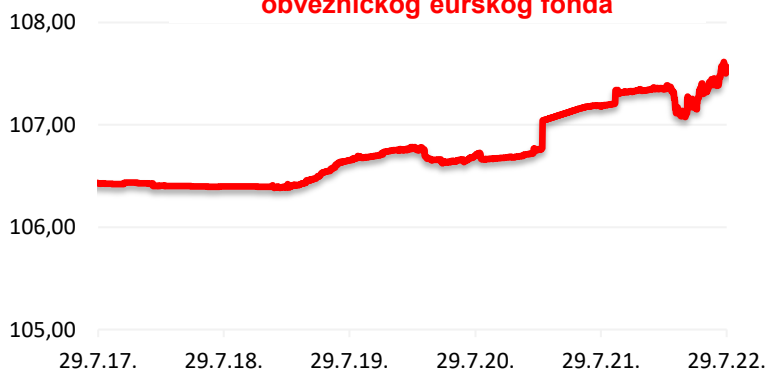
Kretanje cijene udjela HPB Kratkoročnog obvezničkog eurskog fonda

Investicijski cilj fonda je nastojanje ostvarivanja porasta vrijednosti imovine te ostvarivanja prihoda od kamatonosne imovine u kratkom ili srednjem roku većeg od kratkoročnih stopa na tržištu novca s visokom likvidnošću i niskom volatilnošću imovine, a ulaganjem pretežito u obveznice, a zatim u depozite te instrumente tržišta novca izdavatelja s područja Republike Hrvatske te ostalih država članica EU i OECD-a pri čemu ne smije biti ugrožen investicijski cilj fonda. Društvo će nastojati ostvariti opisani investicijski cilj te ne može dati garanciju da će isti biti ostvaren. Društvo koristi aktivnu strategiju upravljanja Fondom, uz potpunu diskreciju ulaganja imovine Fonda te ne koristi referentne vrijednosti (benchmark).